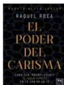
EL PODER DEL CARISMA Raquel Roca LID, 192 pp., 22,95 €

La realidad es que toda sociedad necesita de buenos emprendedores que sean buenos empresarios. Sí, de «los que pagan la fiesta» y trabajan incansablemente por un futuro mejor. Por eso, este libro invita a los lectores a explorar su propio potencial emprendedor y profundiza en el papel crucial de los headhunters, cuya habilidad para identificar a los líderes adecuados puede marcar un punto de inflexión en la evolución de una empresa. Una narración inspiradora repleta de consejos prácticos, lecciones aprendidas y herramientas para navegar por el complejo mundo del emprendimiento y se sumerge en la mente profesional de esos talentos capaces de transformar carreras, negocios y vidas con sus decisiones estratégicas. Cómo trabajan, qué habilidades valoran, qué talentos buscan y cómo sus decisiones pueden marcar un giro radical en tu carrera.