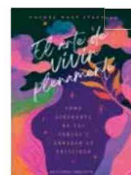
EL ARTE DE VIVIR PLENAMENTE Rachel Macy Stafford

El libro incluye comentarios para comprender y recordar las acciones de cada punto, junto con fórmulas de tratamiento clásicas y modernas para aplicar en la consulta. Una guía precisa, dinámica y extremadamente completa que, sin duda, se convertirá en la mejor herramienta tanto para el estudiante como para el profesional de la acupuntura y la medicina china.