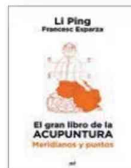
EL GRAN LIBRO DE LA ACUPUNTURA Li Ping y Francesc Esparza MARTÍNEZ ROCA, 584 pp., 39,90 €

La mejor y más extensa obra sobre acupuntura jamás publicada en español, fruto de la experiencia profesional de Li Ping tras dedicar más de treinta años a la formación. Un libro de manejo sencillo y ágil, con cientos de ilustraciones en color y códigos QR con acceso a más de cuatrocientos vídeos de localización y punción.