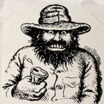
George Washington Hayduke