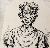
books4pocket «Seldom Seen» Smith