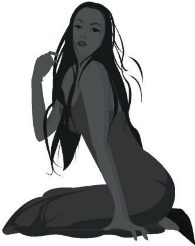
GEORGE SAND 1804-1876

PENETRANTE NOVELA PSICOLÓGICA, LA SUTILEZA DE CUYA AUTORA INFLUYÓ EN PROUST.